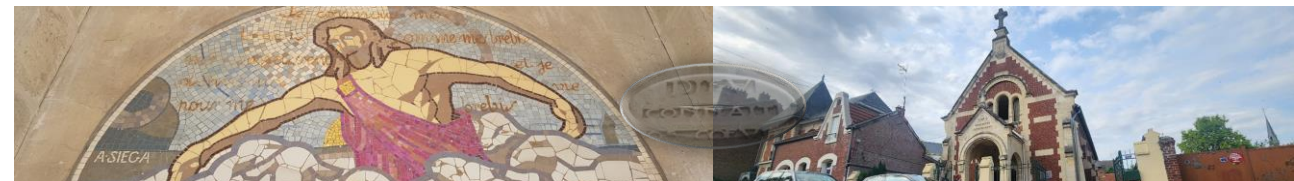
Église évangélique baptiste de Chauny