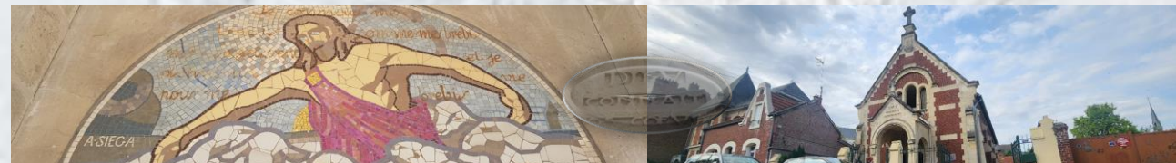
Église évangélique baptiste de Chauny