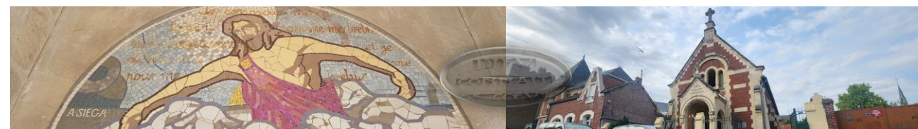
Église évangélique baptiste de Chauny