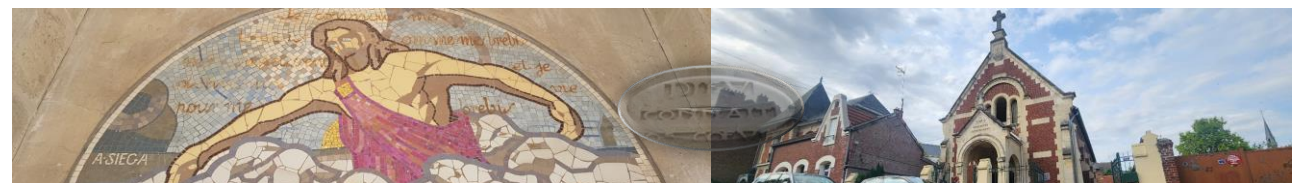
Église évangélique baptiste de Chauny