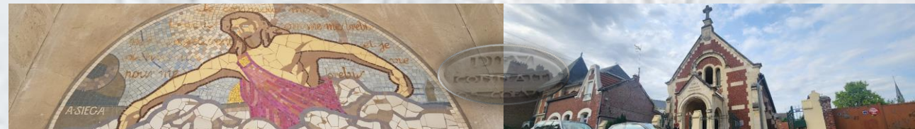
Église évangélique baptiste de Chauny