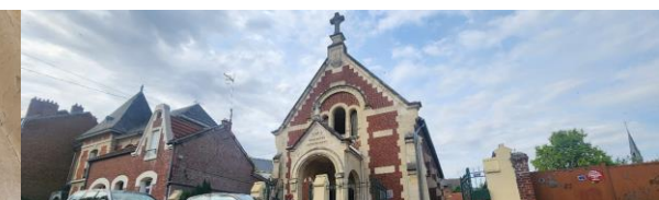
Église évangélique baptiste de Chauny