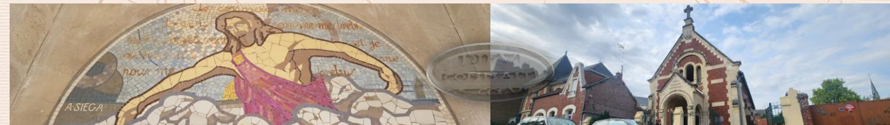
Église évangélique baptiste de Chauny