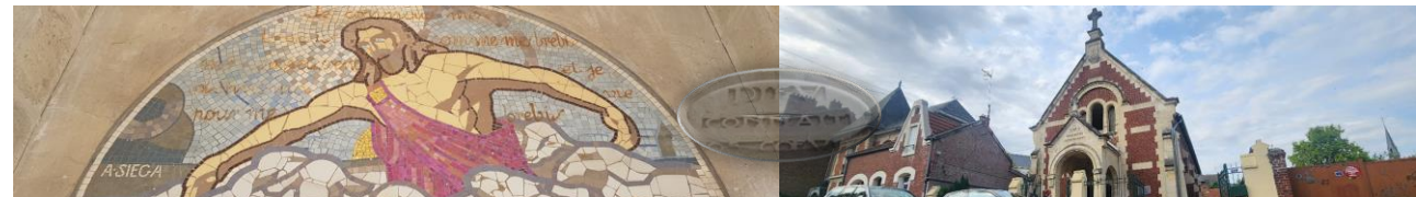
Église évangélique baptiste de Chauny